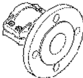
Bride fixe - Figure 2