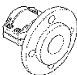
Bride tournante - Figure 1